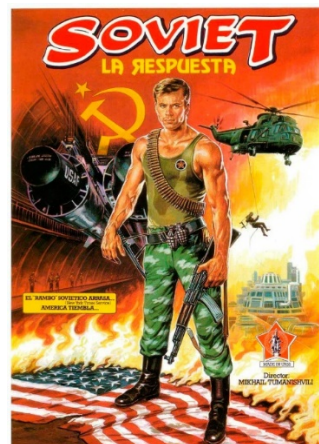
Película “Soviet, la respuesta” (1987). Link: